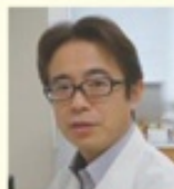
ふくだクリニックの携帯サイト