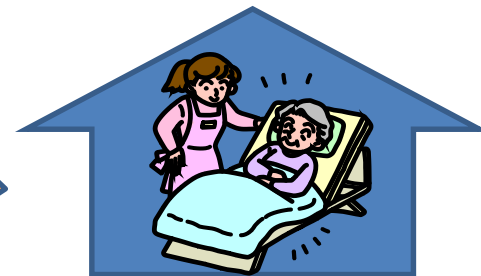
《在宅の要介護者と家族》